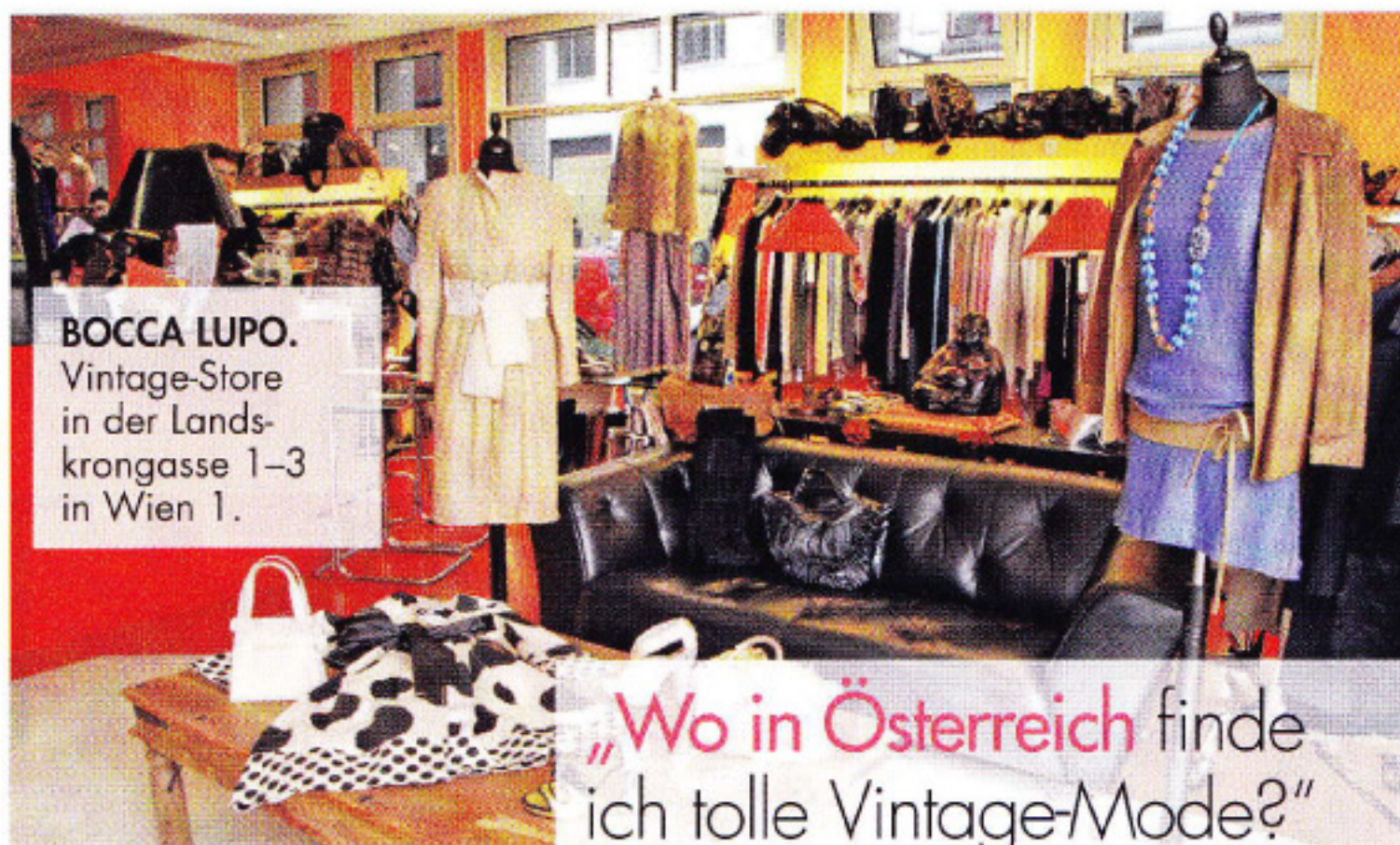
BOCCA LUPO. Vintage-Store in der Landkronngasse 1-3 in Wien 1.