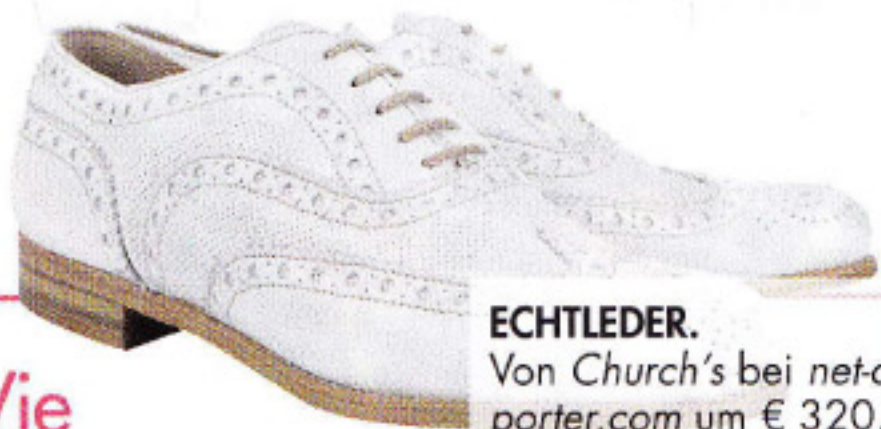
ECHTLEDER. Von Church's bei net-a-porter.com um € 320,-.